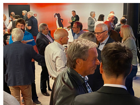
Get-together und Networking nach der HV: Beim Apéro riche im 1. Stock.