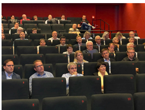
Gut besuchter Kino Rex: Die 144. Ausgabe fand erstmals seit 2019 wieder physisch statt.